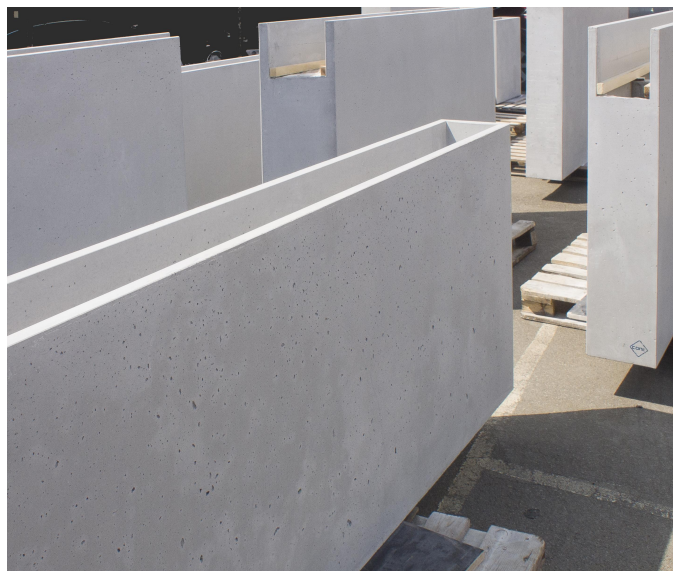
м.Київ Salateira. Вироби за індивідуальним замовленням (цветочные вазоны) CONC.