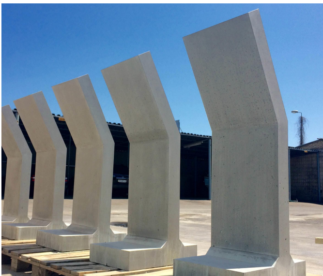
Деталі для розміщення навігації. Проект Виго-о.

За запитом можливі різні текстури поверхні і фарбування деталей в масі.