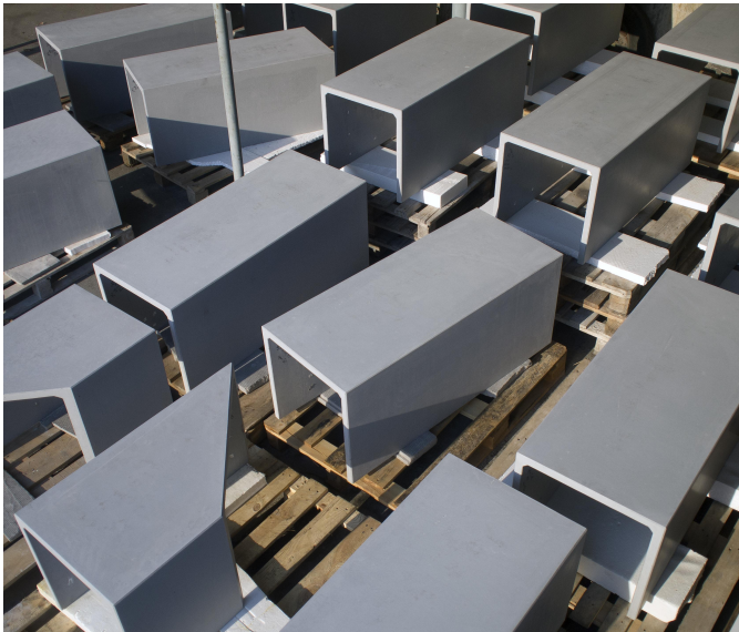
Вироби за індивідуальним замовленням CONC для компанії ZINCO Ukraine.

Матеріал: високоміцний фибробетон CONC Обробка: травлення, шліфування, водовідштовхувальне покриття колір: світло-сірий, білий, на вибір із палітри